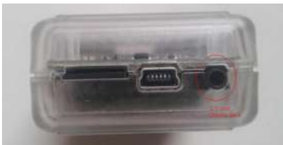
Рисунок 3. Вид адаптера со стороны гнезд подключения.