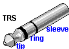
Рисунок 2. Штеккер стандарта 2.5 мм Jack.