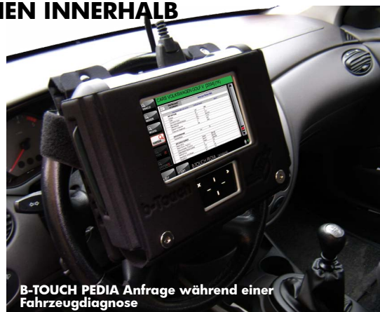
B-TOUCH PEDIA Anfrage während einer Fahrzeugdiagnose

Mit B-TOUCH PEDIA stehen Ihnen eine Menge Informationen zur Verfügung, häufig mit umfangreicheren Inhalten, als andere auf dem Markt befindliche Lösungen. Weiterhin haben Sie den Vorteil, die Inhalte sowohl über das hochauflösende Display des B-TOUCH wie auch über Ihren PC anzuzeigen und die für Sie interessanteren Diagramme auszudrucken.